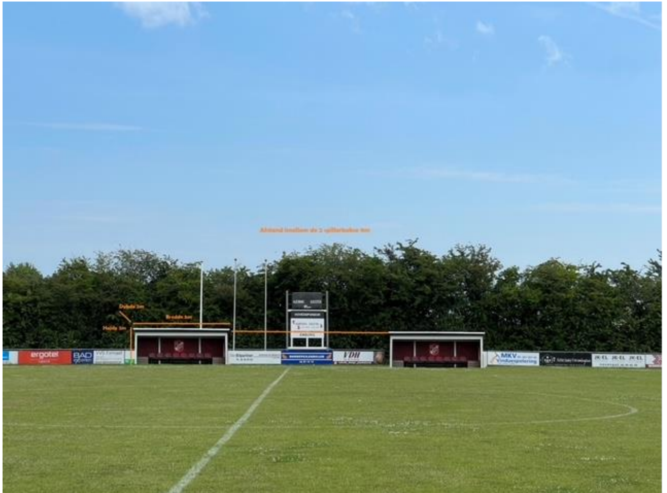
Billede 1. viser det eksisterende spillerskur til højre for måltavlen, og det ansøgte spillerskur til venstre for måltavlen.

Spillerskuret er lavet af trykimprægneret træ, heraf stolper og klinkbeklædning. Taget er tagpap.