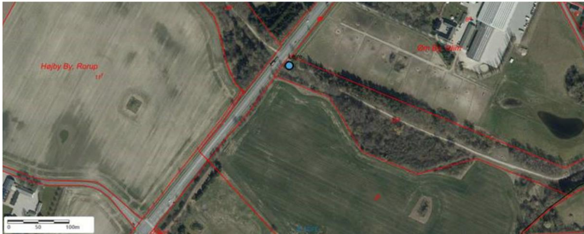
Billede 2. Den blå prik indikerer hvor på ejendommen skurvognen og containeren er opstillet.