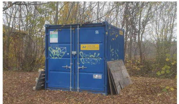
Billede 1. Viser den ansøgte skurvogn og container på arealet.