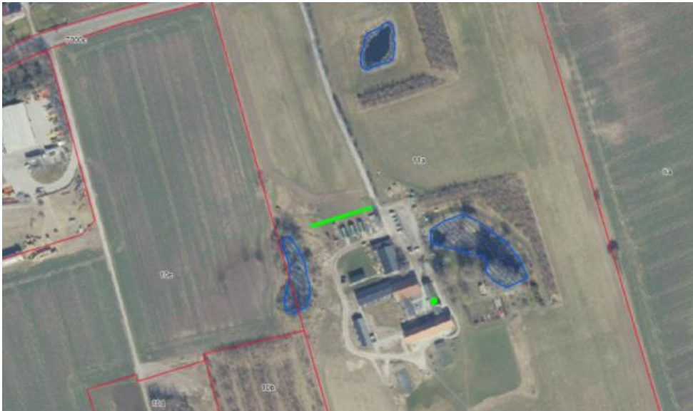
Figur 1. Den grønne streg indikerer den læbeplantning som skal bibeholdes med vilkåret.