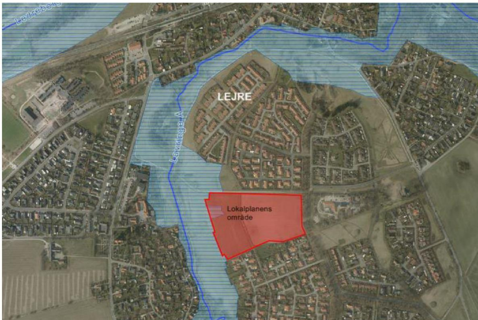
Kortbilag fra kommunens ansøgning