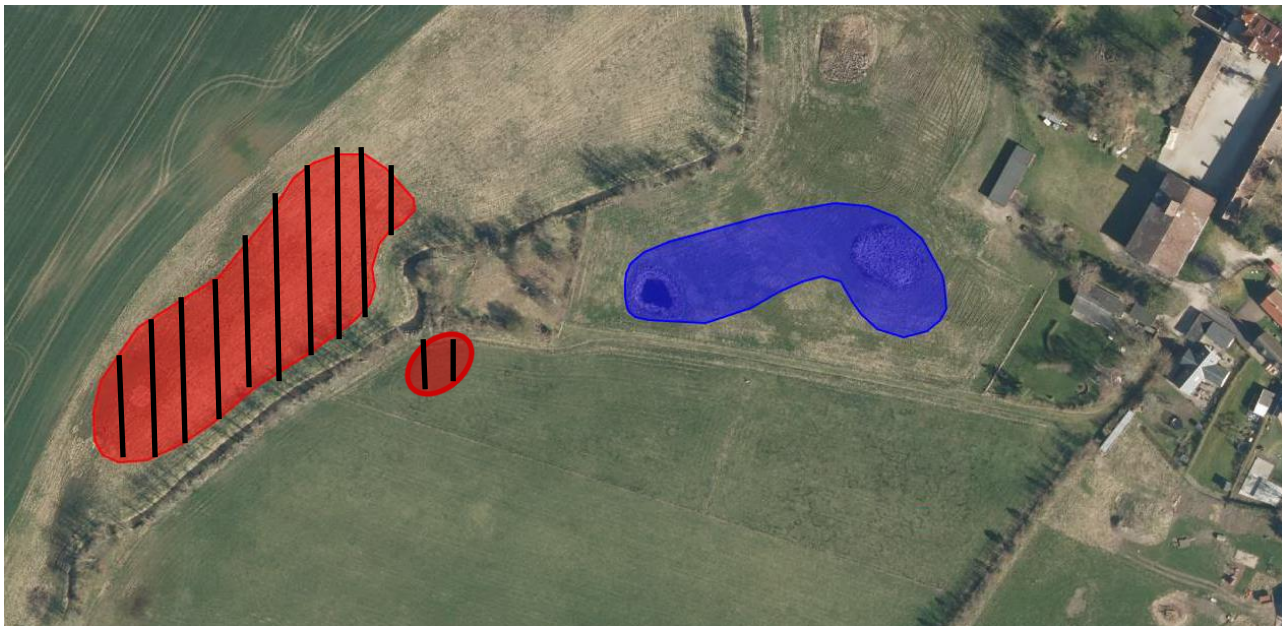
Figur 1. Skitse over den oprindelige samt den nye placering af det nye regnvandsbassin ved Øm.