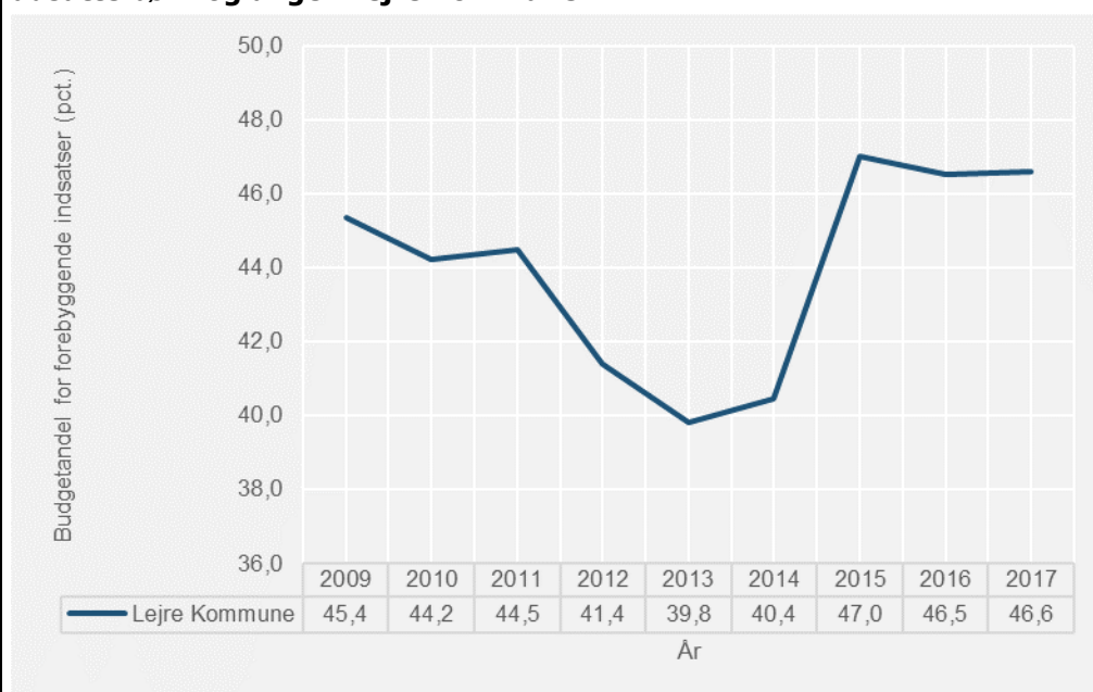
Figur 1.1.1 Forebyggende og hjemmebaserede indsatsers andel af det samlede budget vedr. udsatte børn og unge i Lejre Kommune

Note: Budgetandelen opgøres som den andel, udgifterne på funktion "5.28.21 Forebyggende foranstaltninger for børn og unge" udgør af de samlede udgifter på funktionerne 5.28.20, 5.28.21, 5.28.22, 5.28.23 og 5.28.24.