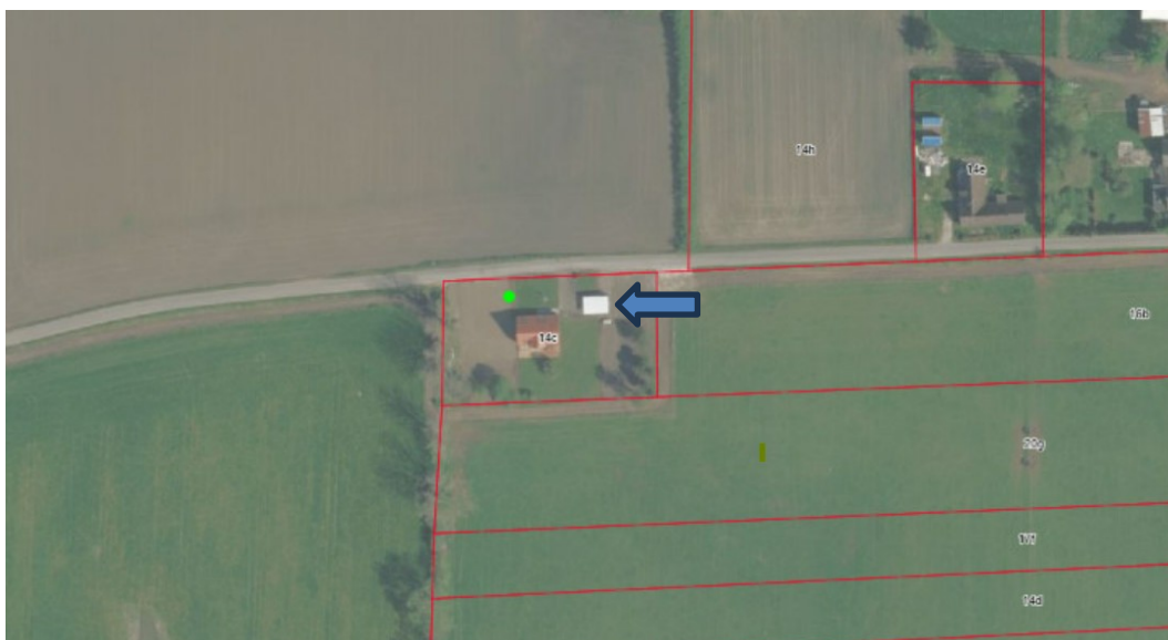
Figur 2. Oversigtskort der viser ejendommens eksisterende bebyggelse samt haverum. Pilen peger på den eksisterende bygning som udvides med et redskabsskur.