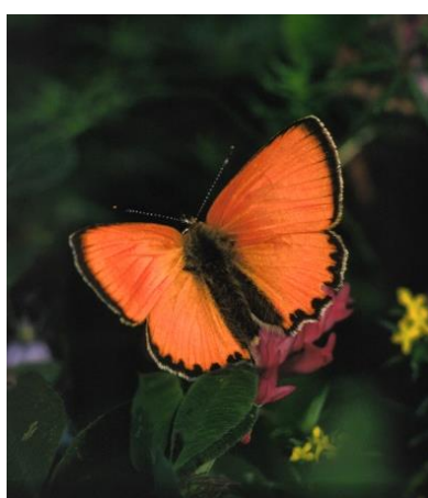
Dukat sommerfugl

http://ec.europa.eu/agriculture/index_da.htm