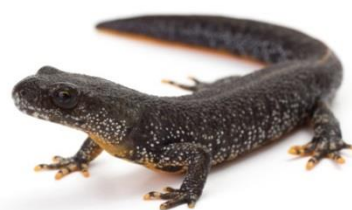
Stor vandsalamander